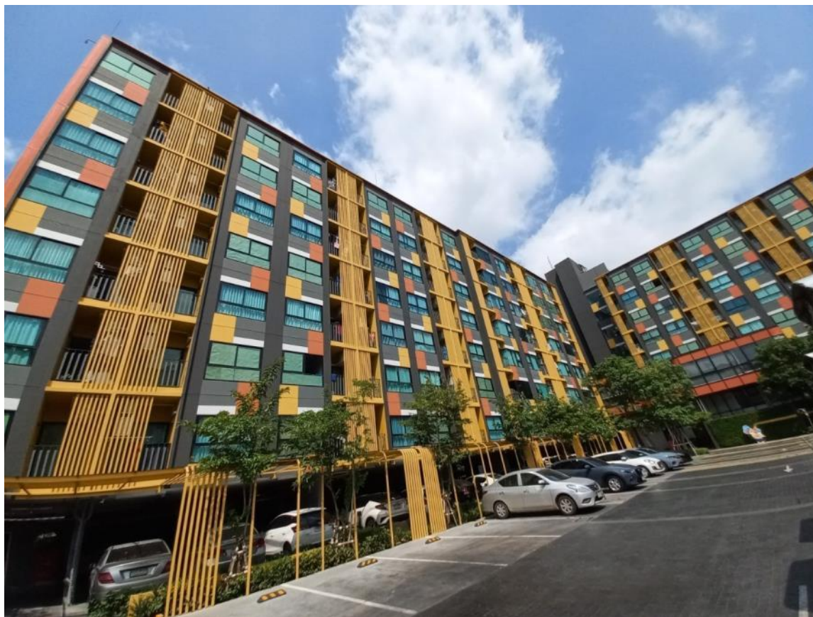
รูปที่ 1.3 สภาพโครงการในปัจจุบัน