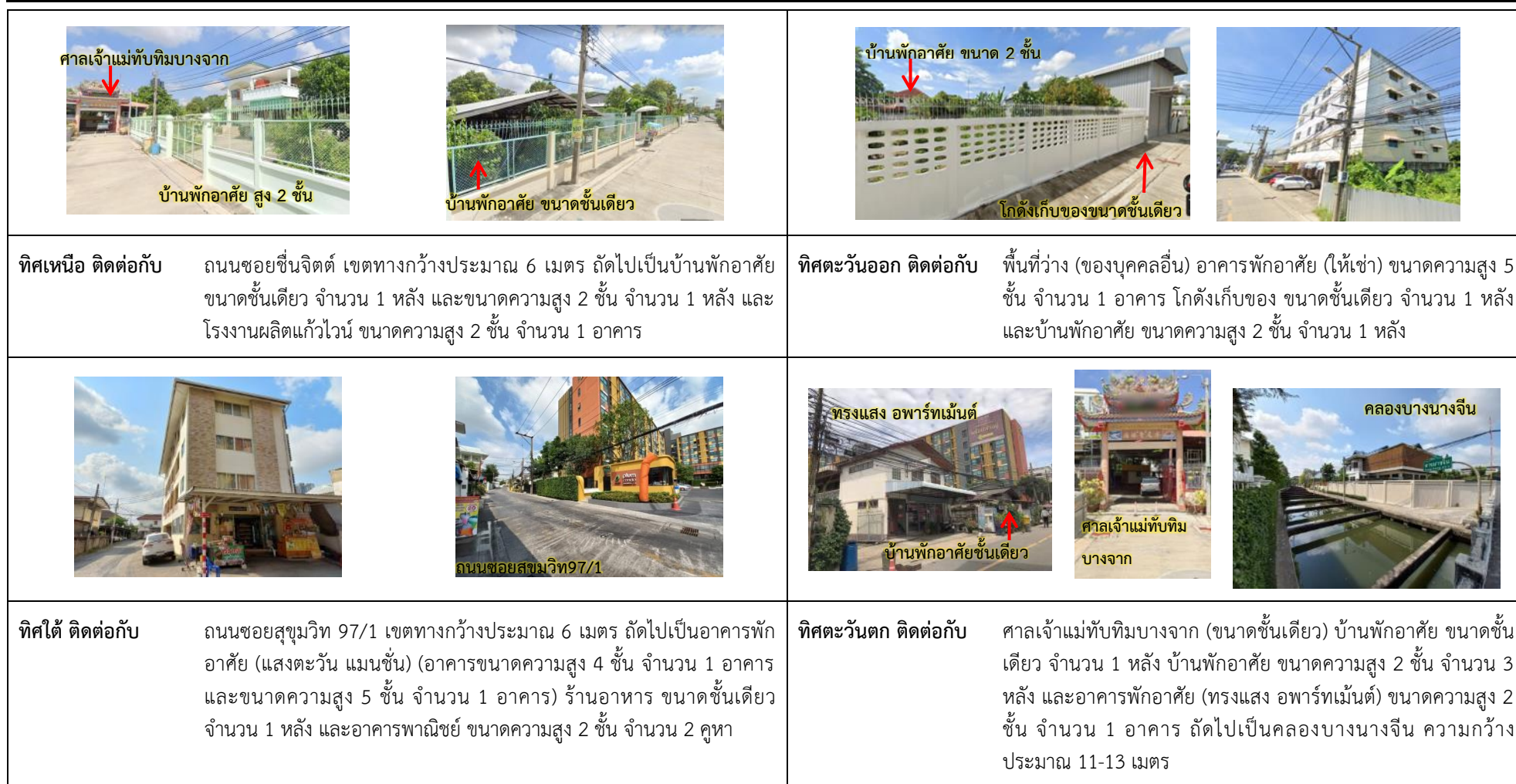
รูปที่ 1.2 ผังแสดงการใช้ประโยชน์บริเวณพื้นที่โครงการและพื้นที่ใกล้เคียง